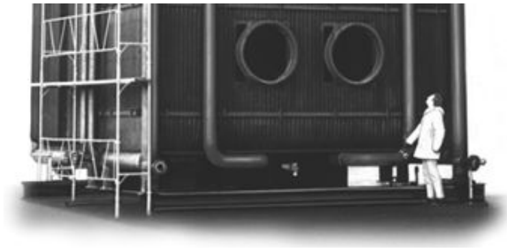
Abb. 14: Ein Eckrohrkessel im Größenvergleich