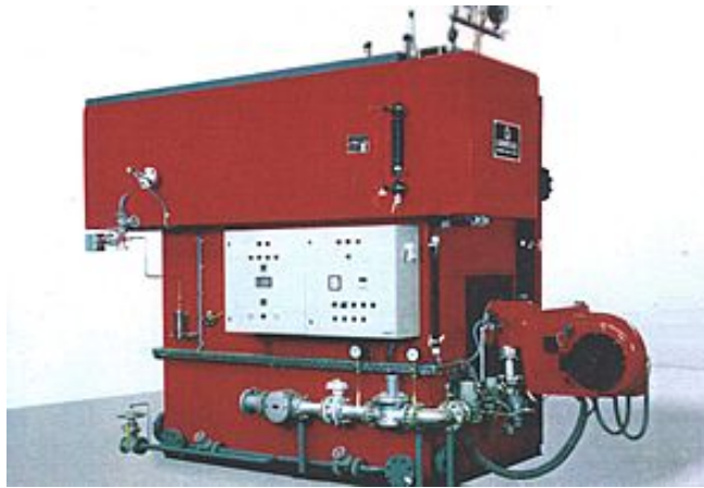
Abb. 13: Schneider-Eckrohrkessel